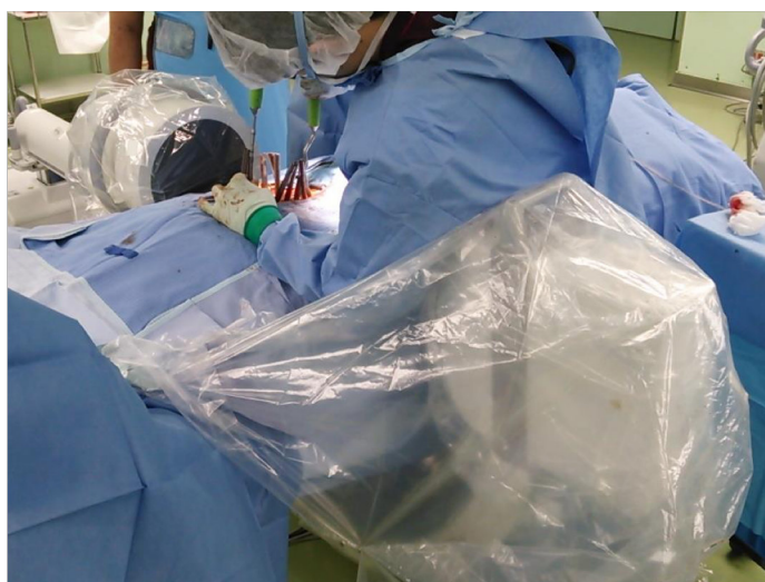
清潔領域が維持され、安心してかつ効率よく手術が進む。