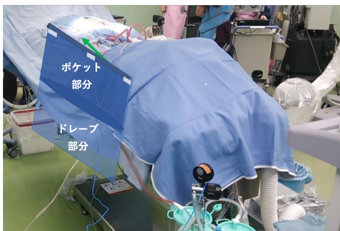
両面テープで患者ドレープ（手術台）に固定する。

一件の手術はこの一枚のドレープで何回でも清潔に撮影できます。 C-アームを手術台の下に回す際、清潔・不潔の境界線を明確にするためオイフを何枚も使用するのとは不要になります。