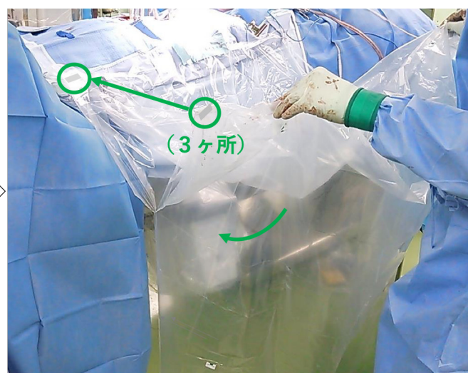
撮影を終えたら、C-アームを元の位置に戻し、 ポケットを再びマジックテープで手術台側に固定する。 一件の手術中、清潔な撮影は何回でも可能になる。