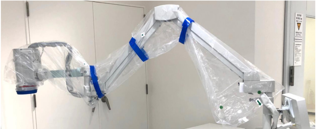
アーム用カバー 装着後全体像

清潔状態を保ちながら、近赤外光の不要な散乱を防ぎ、歪みや曇りのない画像を提供します。