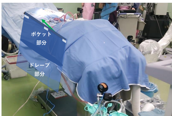
両面テープで患者ドレープ（手術台）に固定する。

一件の手術はこの一枚のドレープで何回でも清潔に撮影できます。 C-アームを手術台の下に回す際、清潔・不潔の境界線を明確にするためオイフを何枚も使用するのとは不要になります。